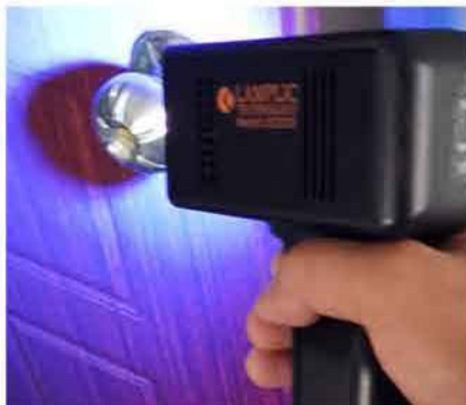
Door handle disinfection