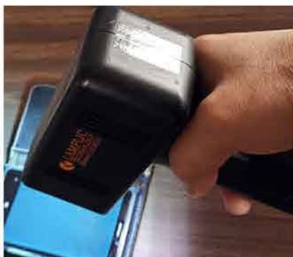
mobile phone disinfection