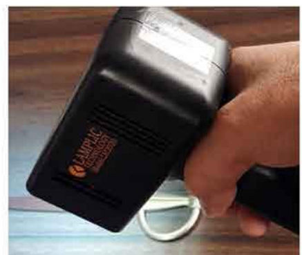
Surgical instrument disinfection